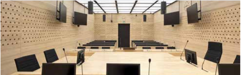
Nouvelle salle d'audience de la chambre commerciale internationale de la cour d'appel de Paris New courtroom of the International Commercial Chamber of the Paris Court of Appeal