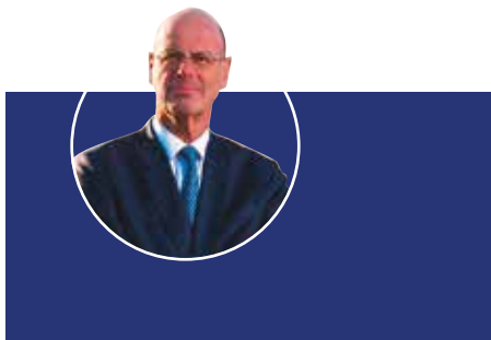
Éric Lombard Ministre de l'Économie, des Finances et de la Souveraineté industrielle et numérique

L'économie ne se pense plus sans le droit, non plus que le droit sans l'économie. La tendance était structurelle, mais la conjoncture géopolitique la rend plus évidente encore. C'est en ce sens que mon ministère se mobilise, plus intensément encore en ce début 2025, bien conscient des enjeux que pose un droit fort et juste au-delà du simple encadrement des pratiques et du règlement des litiges.